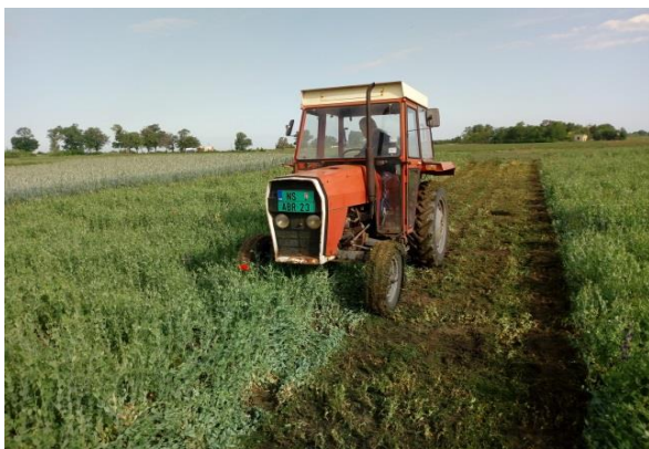
Slika 1. Usitnjavanje međuseva pred zaoravanje