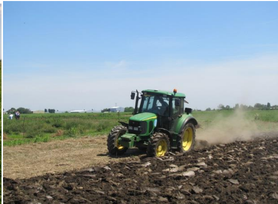
Slika 2. Zaoravanje – zelenišno đubrenje

Figure. 1. Mulching cover crops before plowing Figure. 2. Plowing cover crops after mulching